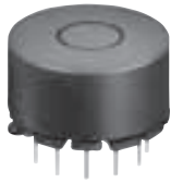
DIMENSIONS (mm) 外形寸法図

Drum-Pot type inexpensive inverter transformer using nickel core. ニッケルコア材を使用したドラム/ポットコア構造による廉価版インバータトランス。