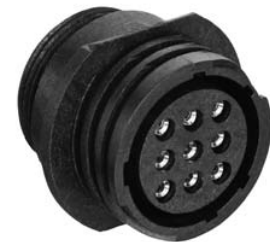
Bild A (dargestellt: DELK1720-P09) figure A (shown: DELK1720-P09)