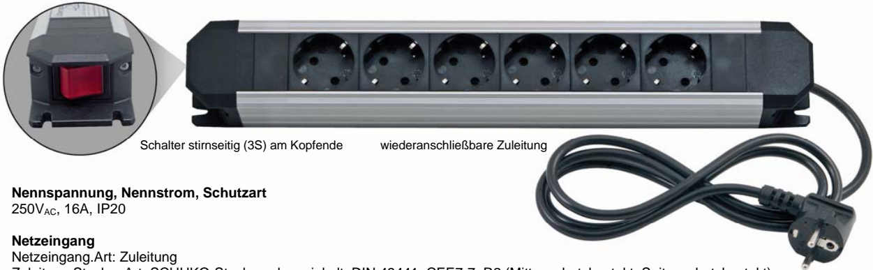
Schalter stirnseitig (3S) am Kopfende wiederanschließbare Zuleitung

Nennspannung, Nennstrom, Schutzart 250V AC , 16A, IP20