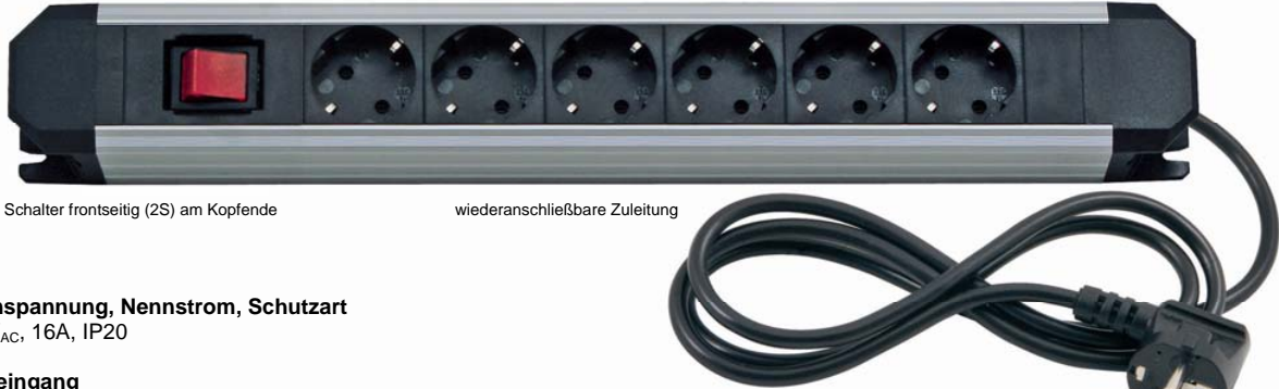
Schalter frontseitig (2S) am Kopfende