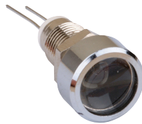
Art.-Nr. RTM 5070

Seals allow the infrared diode to be used in water jet-proof IP65 designs. Supplied with washer and hexagonal nut.