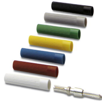
Abbildung zeigt MPS-MT Prüfstecker und Isolierhülsen

http://eshop.phoenixcontact.de/phoenix/treeViewClick.do?UID=0201744