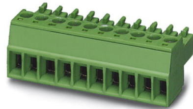
Abbildung zeigt eine 10-polige Variante des Artikels

http://eshop.phoenixcontact.de/phoenix/treeViewClick.do?UID=1840353