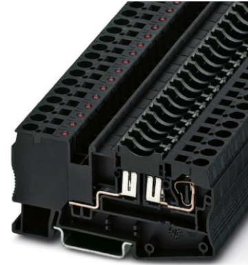
Abbildung zeigt die Variante ST 4-/C-LED 24

http://eshop.phoenixcontact.de/phoenix/treeViewClick.do?UID=3036495