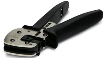
Abbildung zeigt die Crimpzange CRIMPFOX LC

http://eshop.phoenixcontact.de/phoenix/treeViewClick.do?UID=1207420