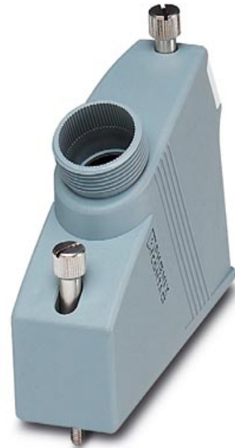
Abbildung zeigt die Variante VC-K-T3-R

http://eshop.phoenixcontact.de/phoenix/treeViewClick.do?UID=1855128