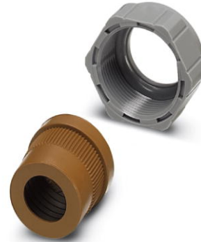
Abbildung zeigt die Variante Pg16

http://eshop.phoenixcontact.de/phoenix/treeViewClick.do?UID=1853900