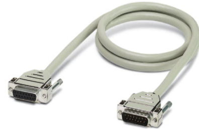
Abbildung zeigt eine 15-polige Variante

http://eshop.phoenixcontact.de/phoenix/treeViewClick.do?UID=2302201