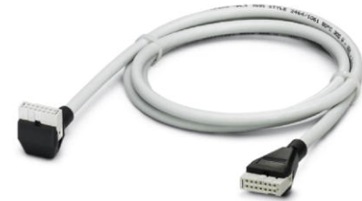
Abbildung zeigt die 14-polige Produktvariante

http://eshop.phoenixcontact.de/phoenix/treeViewClick.do?UID=2318554