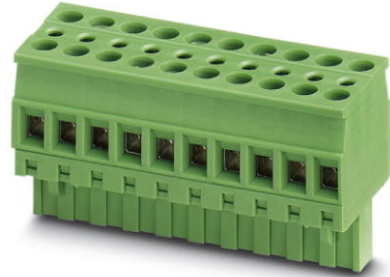
Abbildung zeigt die 10-polige Variante

http://eshop.phoenixcontact.de/phoenix/treeViewClick.do?UID=1719011