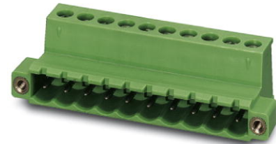
Abbildung zeigt eine 10-polige Variante des Artikels

http://eshop.phoenixcontact.de/phoenix/treeViewClick.do?UID=1825530