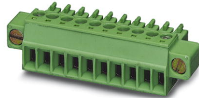
Abbildung zeigt eine 10-polige Variante des Artikels

http://eshop.phoenixcontact.de/phoenix/treeViewClick.do?UID=1847071