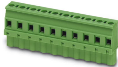
Abbildung zeigt eine 10-polige Variante des Artikels

http://eshop.phoenixcontact.de/phoenix/treeViewClick.do?UID=1737835