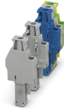
Abbildung zeigt verschiedene Varianten des Produktes (linkes, mittleres und rechtes Element) in verschiedenen Farbstellungen

http://eshop.phoenixcontact.de/phoenix/treeViewClick.do?UID=3045716