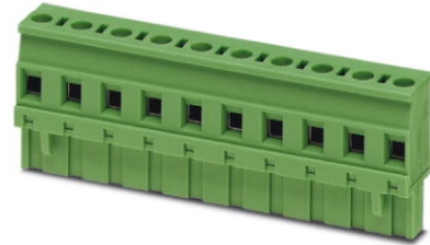
Abbildung zeigt eine 10-polige Variante des Artikels

http://eshop.phoenixcontact.de/phoenix/treeViewClick.do?UID=1737767