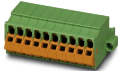
Abbildung zeigt eine 10-polige Variante des Artikels

http://eshop.phoenixcontact.de/phoenix/treeViewClick.do?UID=1718216