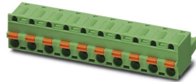
Abbildung zeigt eine 10-polige Variante des Artikels

http://eshop.phoenixcontact.de/phoenix/treeViewClick.do?UID=1939455