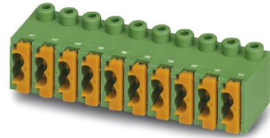
Abbildung zeigt eine 10-polige Variante des Artikels

http://eshop.phoenixcontact.de/phoenix/treeViewClick.do?UID=1913989