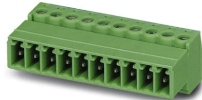
Abbildung zeigt eine 10-polige Variante des Artikels

http://eshop.phoenixcontact.de/phoenix/treeViewClick.do?UID=1857964