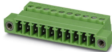
Abbildung zeigt eine 10-polige Variante des Artikels

http://eshop.phoenixcontact.de/phoenix/treeViewClick.do?UID=1858031