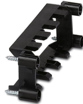
Abbildung zeigt die Variante VC-TR 1/2 M

http://eshop.phoenixcontact.de/phoenix/treeViewClick.do?UID=1852901