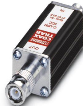
Abbildung zeigt die Variante C-UFB- 5DC

http://eshop.phoenixcontact.de/phoenix/treeViewClick.do?UID=2797861