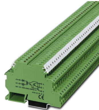
Abbildung zeigt die Variante DEK-OE- 24DC/24DC/100KHZ-G

http://eshop.phoenixcontact.de/phoenix/treeViewClick.do?UID=2964364